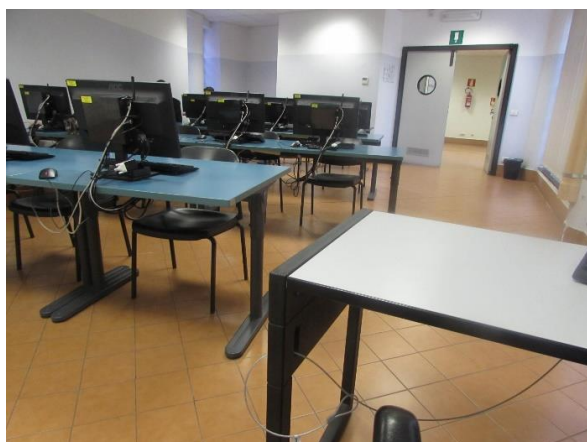
Aula I - Polo Didattico