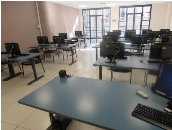
Aula G - Polo Didattico