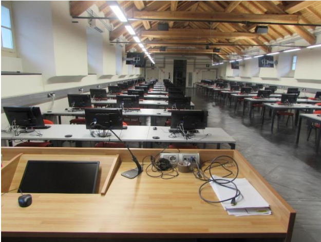
Aula Clat - Albergo dei Poveri