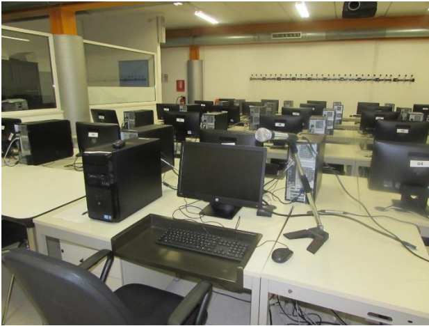
Aula Genovino - Darsena