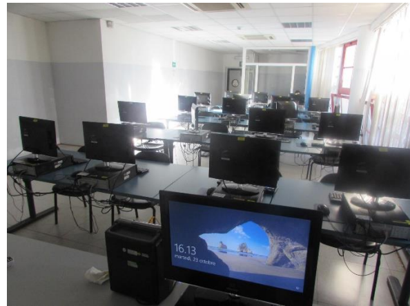
Aula H - Polo Didattico