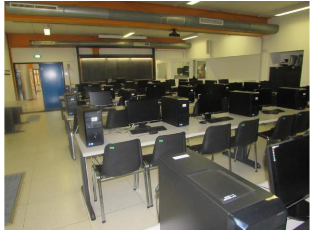
Aula Mandraccio - Darsena

Inoltre, nelle Biblioteche dei Dipartimenti e nella Biblioteca di Scuola sono disponibili postazioni informatiche dedicate alle ricerche bibliografiche.