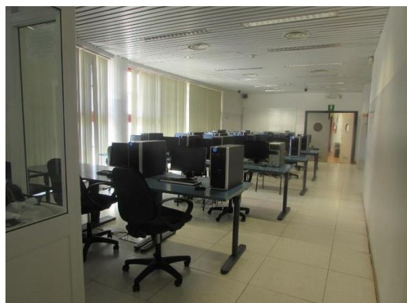
Aula M - Polo Didattico